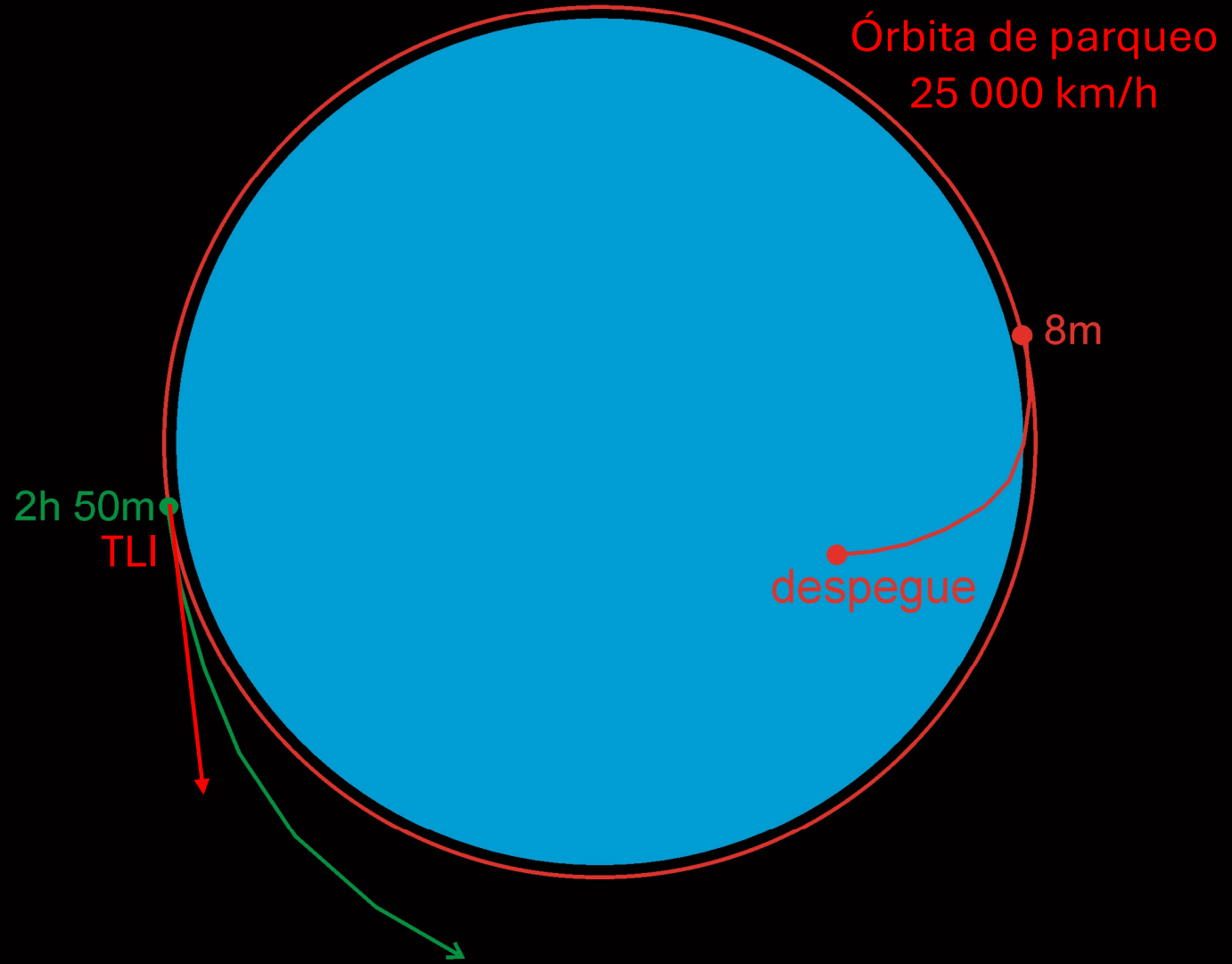
Despegue, órbita de parqueo y Trans Lunar Injection